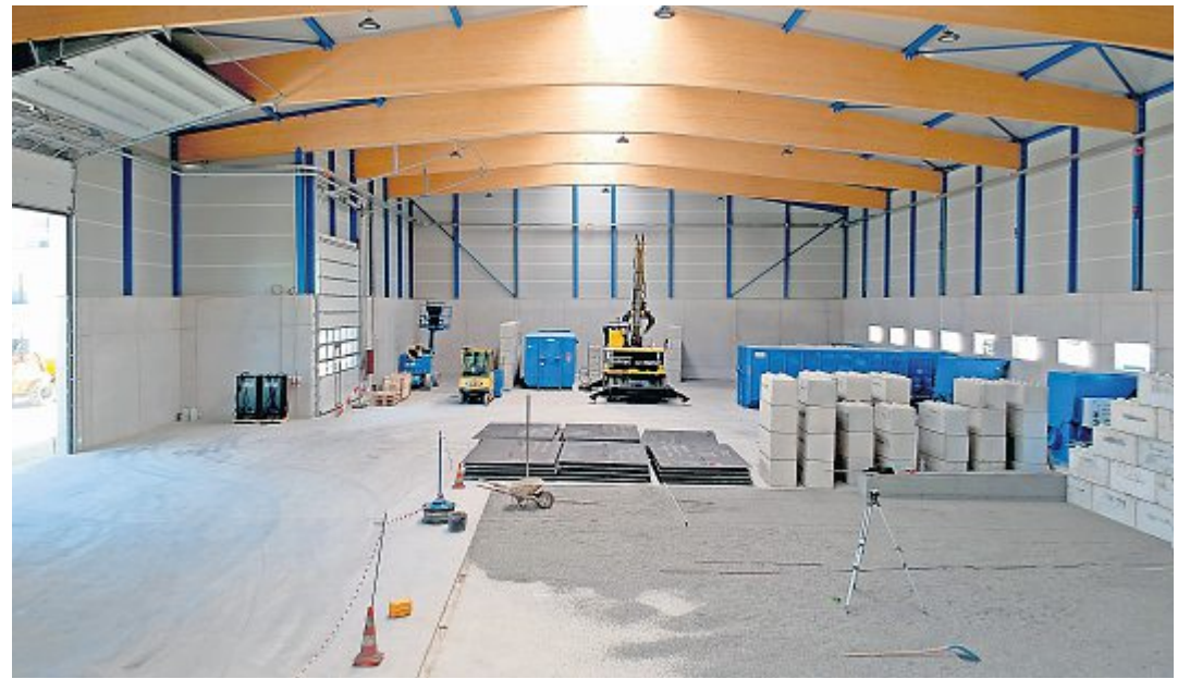
Seit dem offiziellen Spatenstich am 9. Januar 2020 hat sich vieles getan an der Seefeldstrasse.